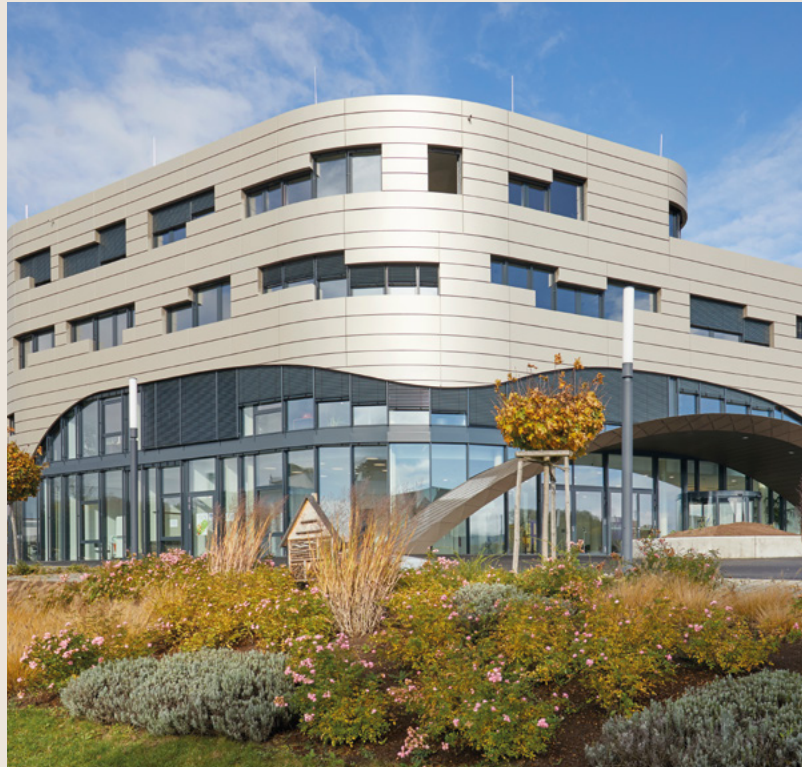
Der Hauptsitz der IDS Imaging Development Systems GmbH.