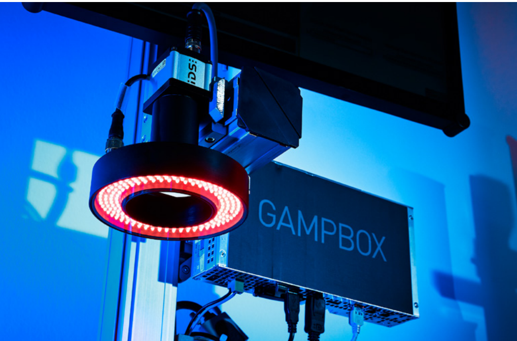
Industriekameras von IDS leisten auch in der pharmazeutischen Industrie und der Medizintechnik wertvolle Dienste

3D-Bildverarbeitung wie in der Robotik und natürlich KI – Künstliche Intelligenz. Letztere erschließt für uns ganz neue Anwendungsfelder. Sie macht Aufgaben lösbar, bei der die klassische, regelbasierte Bildverarbeitung an ihre Grenzen stößt. Wir haben beispielsweise ein KI-Komplettsystem entwickelt, mit dem autonome Bilderkennung deutlich einfacher wird – auch für Laien.