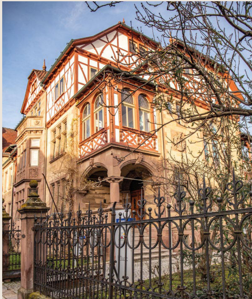
Burmistrak & Partner-Standort im baden-württembergischen Bretten.

Vielen herzlichen Dank für das Gespräch.