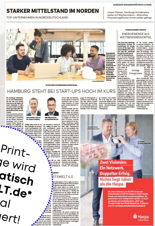
Beispiel Sonderveröffentlichung

Ihre Print-Anzeige wird automatisch auf WELT.de* digital verlängert!