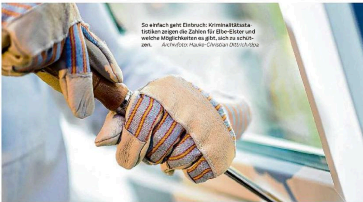
So einfach geht Einbruch: Kriminalitätsstatistiken zeigen die Zahlen für Elbe-Elster und welche Möglichkeiten es gibt, sich zu schützen.

Die Aufklärungsquote bei Straftaten in der Region schwankt von Jahr zu Jahr. Im Jahr 2022 konnten 49,7 Prozent der insgesamt 4748 registrierten Fälle für Elbe-Elster aufgeklärt werden. 2023 stieg dieser Wert auf 56,6 Prozent (bei einer deutlich höheren Fallzahl). Für das Jahr