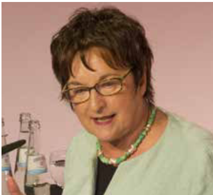
Brigitte Zypries, Bundesministerin für Wirtschaft und Energie, MdB.