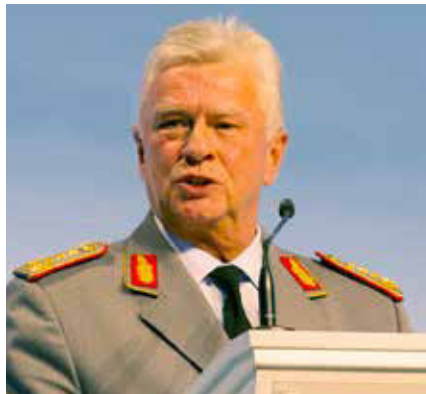
Volker Wierer, Generalinspekteur der Bundeswehr.