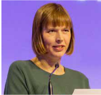
Kersti Kaljulaid, Staatspräsidentin Estlands.