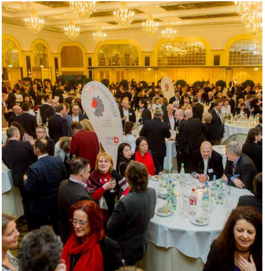
Unternehmer beim Netzwerken.