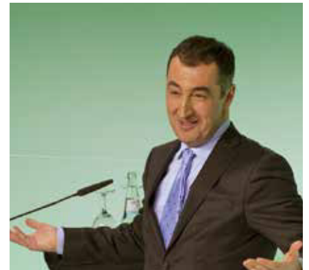
Cem Özdemir, MdB, Bundesvorsitzender Bündnis 90/DIE GRÜNEN.