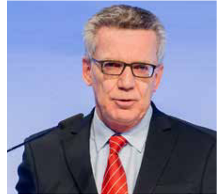
Bundesinnenminister Dr. Thomas de Maizière, MdB.